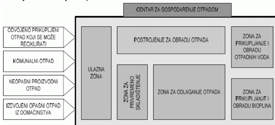
Slika 2 Sadržaj CGO-a i tijek otpada